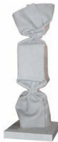
CANDY COLUMN bonbon en marbre