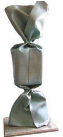
CANDY BRONZI bonbon en bronzi