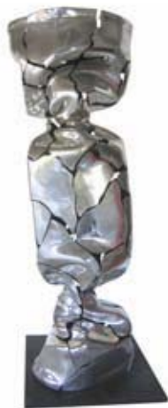
BONBON FRAGMENTE bonbon en aluminium